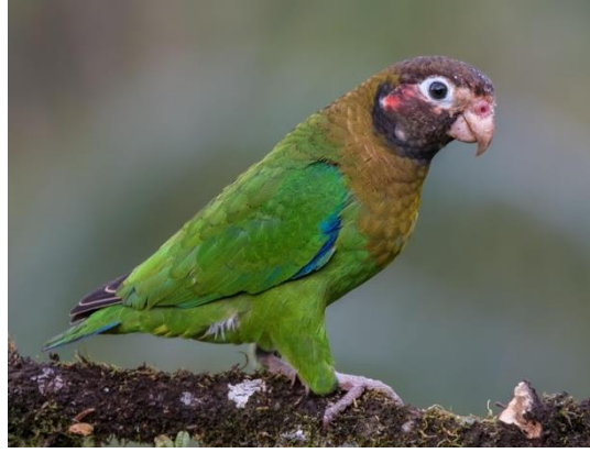
Loro encapuchado ( Pyrilia haematotis )