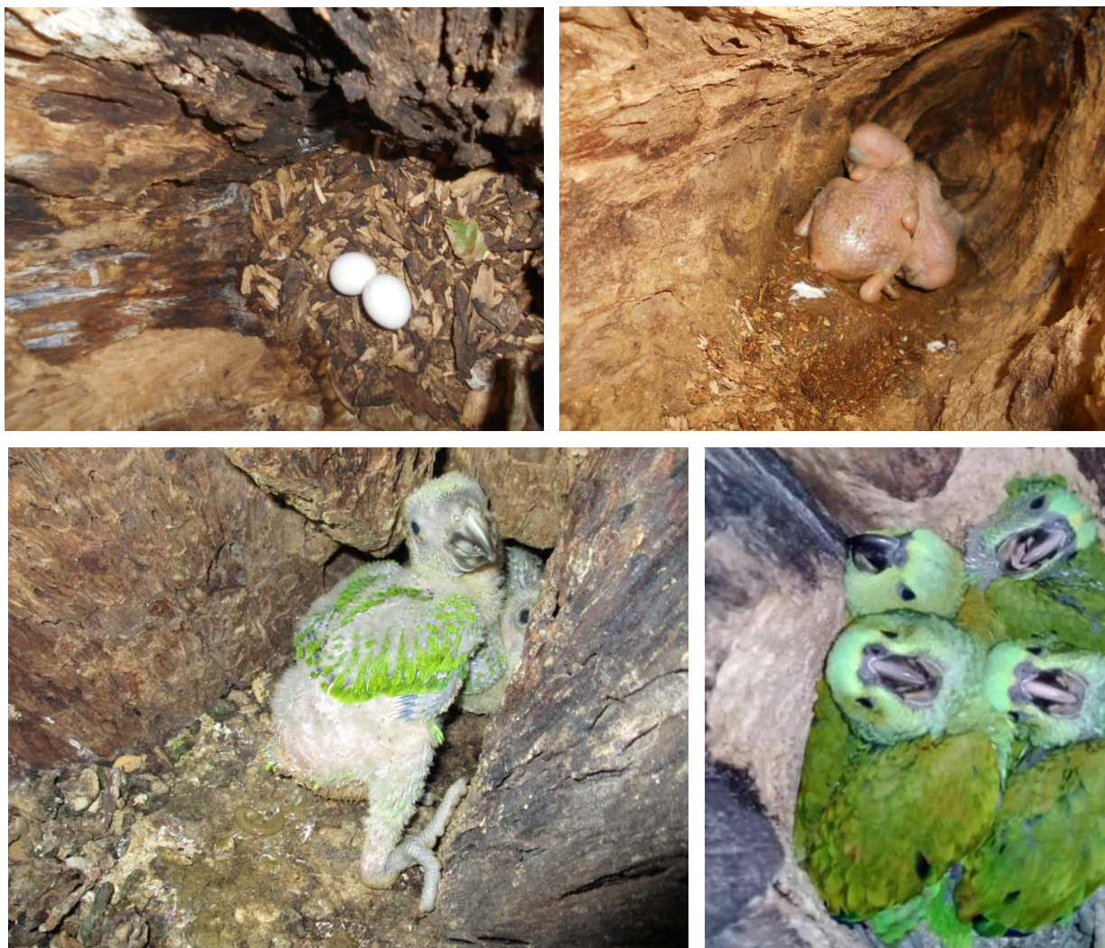
Figura 5. (abajo). Nidos de amazonas silvestres de loro nuca amarilla de izquierda a derecha con dos huevos (número normal de huevos = 3), dos polluelos de 7 a 10 días de edad, 2 polluelos de 4 semanas de edad y 4 polluelos de 6 a 7 semanas de edad (vuelan aproximadamente a los 60 días de edad). Es muy raro que un nido tenga 4 polluelos sanos que emplumen exitosamente.