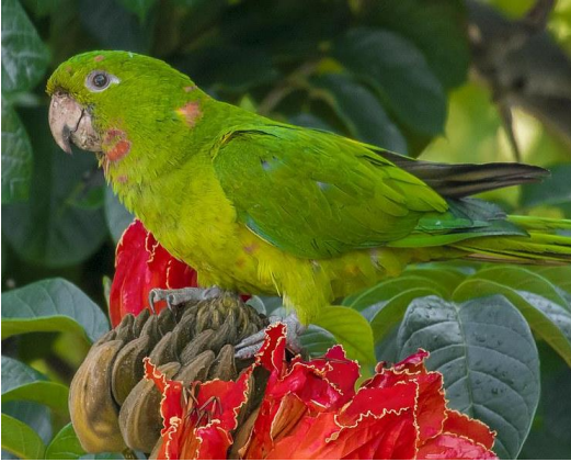
Aratinga verde ( Psittacara holochlorus )