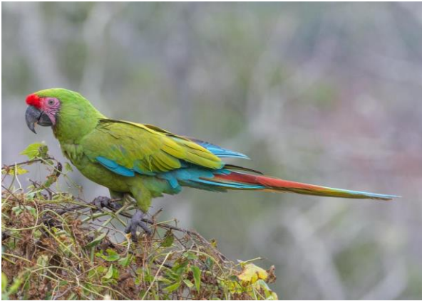
Guacamaya militar ( Ara militaris )