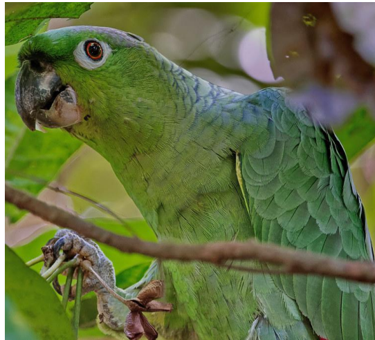
Loro real ( Amazona guatemalae )