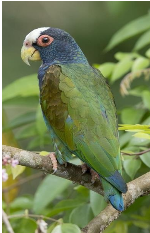
Loro corona blanco ( Pionus senilis )