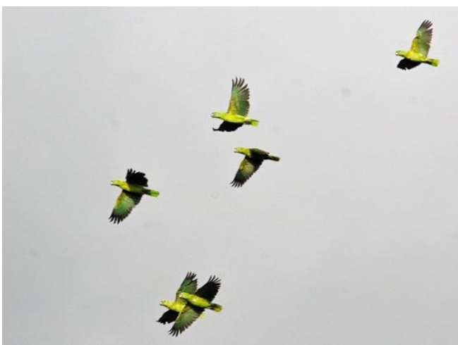
Figura 3. Parvada de juveniles en Nicaragua con poco o algo de color amarillo en la nuca.