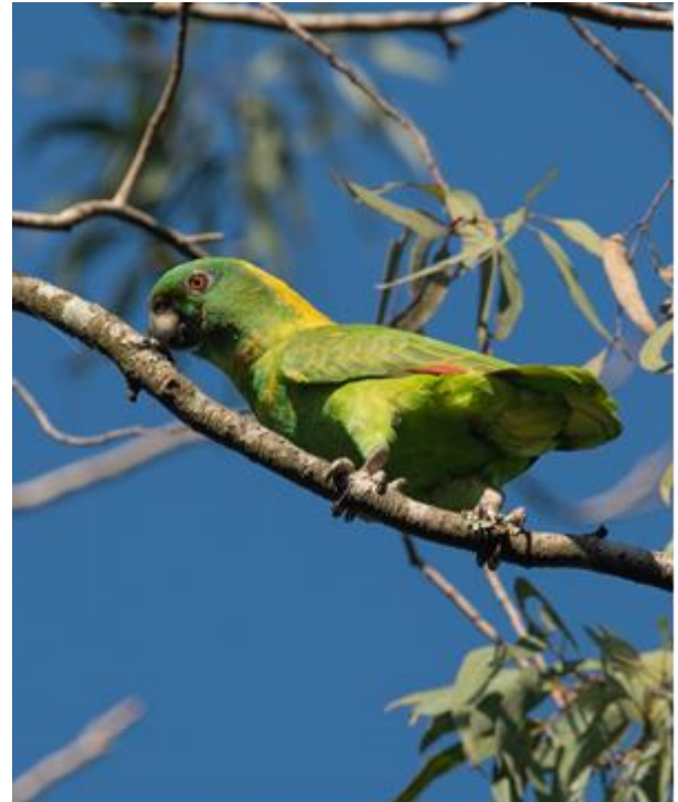
Figura 1. (derecha). Loro nuca amarilla perchado. Se puede observar la mancha amarilla en la parte posterior de la cabeza (nuca) distintivo que le da su nombre común.