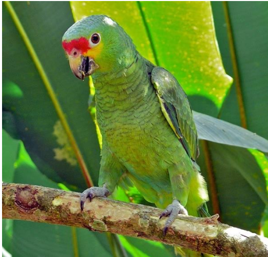
Loro cachete amarillo ( Amazona autumnalis )