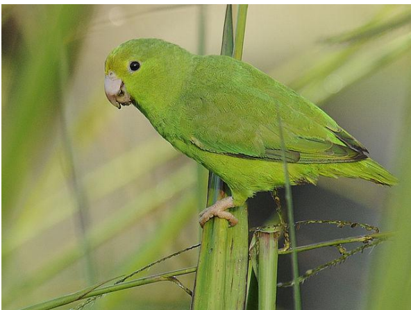
Perica rayada ( Bolborhynchus lineola )