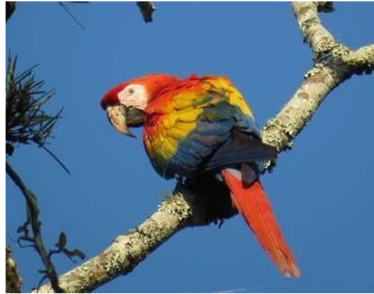
Guacamaya roja ( Ara macao cyanoptera )