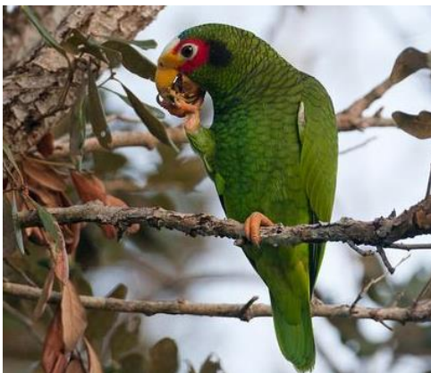
Loro yucateco ( Amazona xantholora )