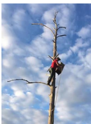
Figura 8. (arriba izquierda)