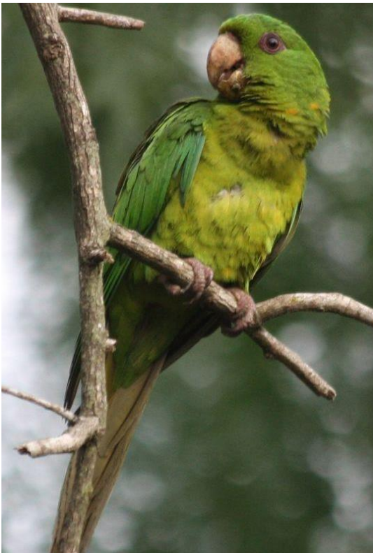
Chocoyo ( Psittacara strenuss )