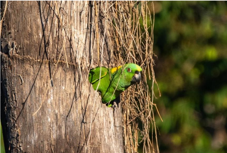
Figura 4. Loro nuca amarilla anidando en una cavidad natural de una palma seca en la costa del Pacífico de Guatemala.