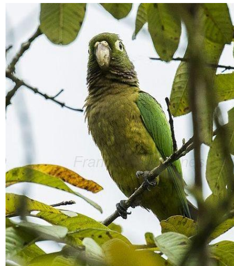
Periquito garganta de olivo ( Eupsittula astec )