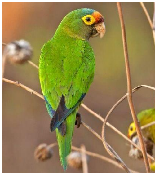
Perico frente naranja ( Eupsittula canicularis )