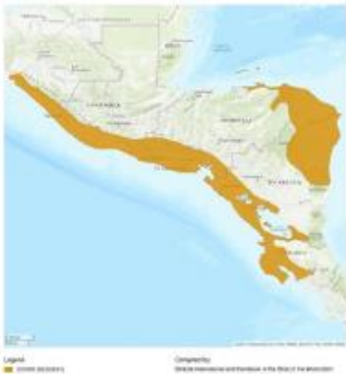
Figura 6. Mapa de distribución del Loro nuca amarilla ( Amazona auropalliata ). (del Hoyo, J., N. Collar, G. M. Kirwan, and C. J. Sharpe (2020). Yellow-naped Parrot ( Amazona auropalliata ), version 1.0. In Birds of the World (J. del Hoyo, A. Elliott, J. Sargatal, D. A. Christie, and E. de Juana, Editors). Cornell Lab of Ornithology, Ithaca, NY, USA. https://doi.org/10.2173/bow.yenpar1.01 )