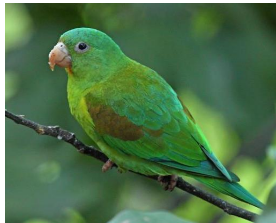
Perico se nora ( Brotogeris jugularis )