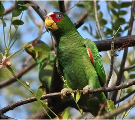
Loro frente blanca ( Amazona albifrons )