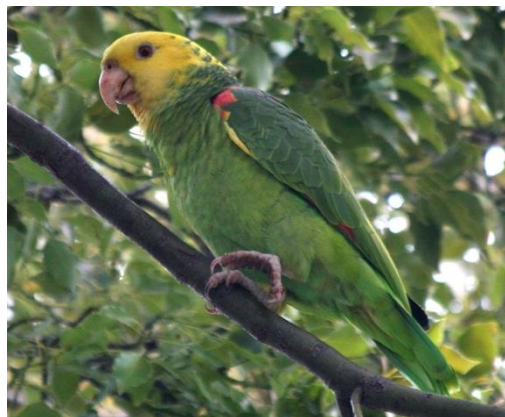
Loro cabeza amarilla ( Amazona oratrix )