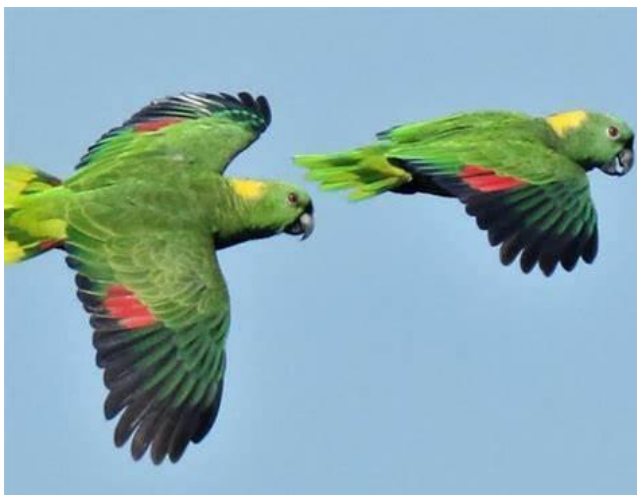
Figura 2. Pareja de Loro nuca amarilla con alas extendidas, se pueden observar las alas redondeadas y la cola corta, así como el color azul en sus plumas primarias y color rojo en parte de las alas secundarias.