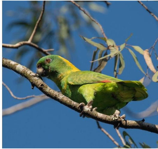
Loro nuca amarilla ( Amazona auropalliata )